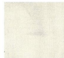
オイル塗布後、 エヌバリアミスト MM を塗布