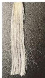
オイル塗布後、 エヌバリアミスト MM を塗布